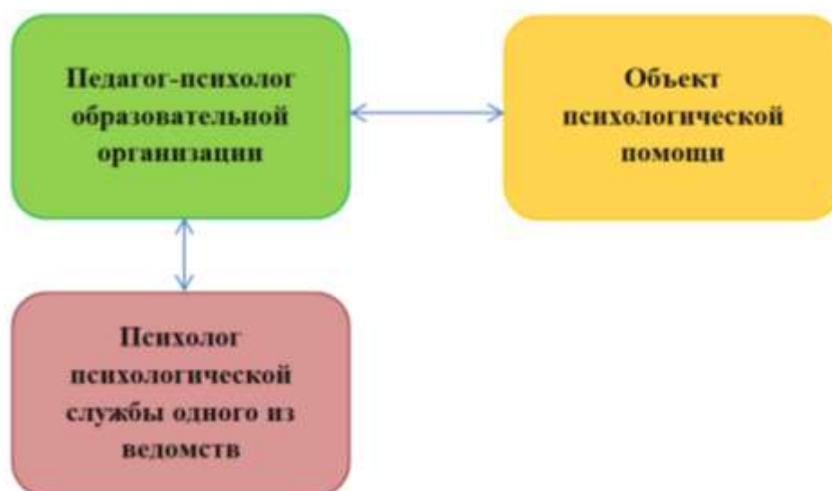
Рисунок 2. Схема двухкомпонентной модели межведомственного психологического сопровождения

Если же для ребенка существует риск радикализации, в связи с наличием в окружении радикально настроенных лиц, то мы можем прибегнуть к помощи психологов сферы молодежной политики, которые работают по профилактике негативных явлений в молодежной среде, могут работать с образовательными организациями по запросу и прорабатывать на групповых занятиях необходимые темы, вопросы.