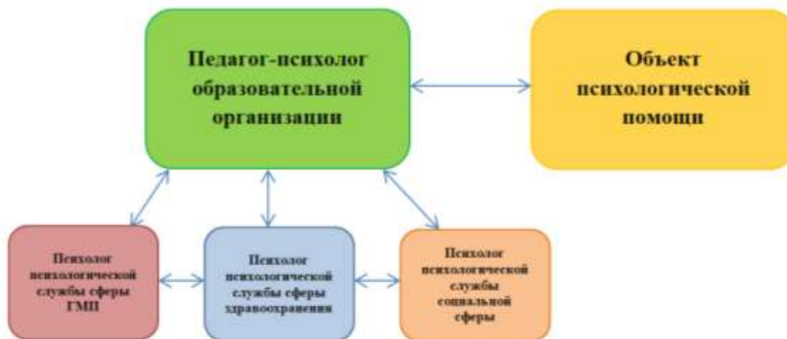
Рисунок 4. Схема четырехкомпонентной модели межведомственного психологического сопровождения

наличие критического мышления у ребенка может сподвигнуть и самих родителей на переосмысления того образа жизни, к которому они привыкли.