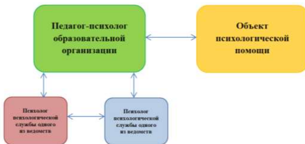
Рисунок 3. Схема трехкомпонентной модели межведомственного психологического сопровождения

Трехкомпонентная модель. В данной модели к взаимодействию привлекаются двое специалистов из тех ведомств, которые подходят по набору компетенций для разрешения выявленной проблемы.